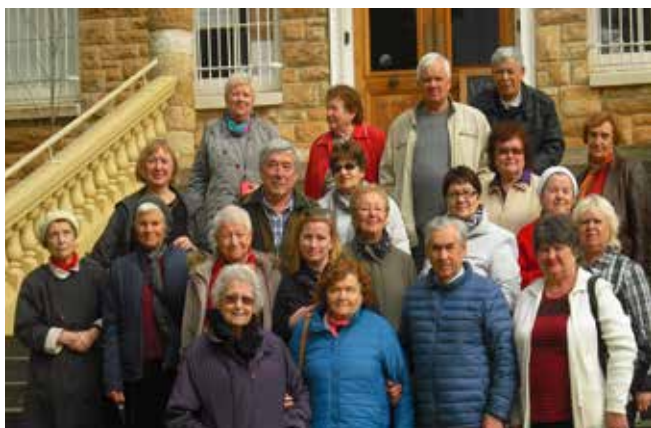
Экскурсия в Бароссу

Принято считать, что с возрастом жизнь становится беднее событиями, что пожилой возраст – это возраст покоя и болезней и что удел пожилого человека – это посещение врачей, книги и вязание у телевизора. Вероятно, с этим утверждением не согласятся жители Аделаиды, где несколько агентств и организаций активно взялись за организацию досуга людей старшего возраста.