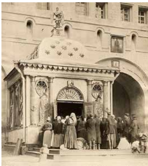
Иверская Часовня у стен Кремля. Конец XIX века.

свидетельств того, что Богородица пребывает постоянно с нами. Через Неё становится зримым на Святой Горе, как бьётся пульс жизни мира.