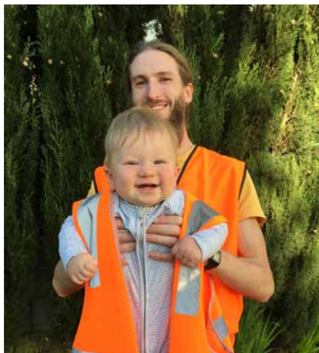
Самый юный дежурный со своим папой